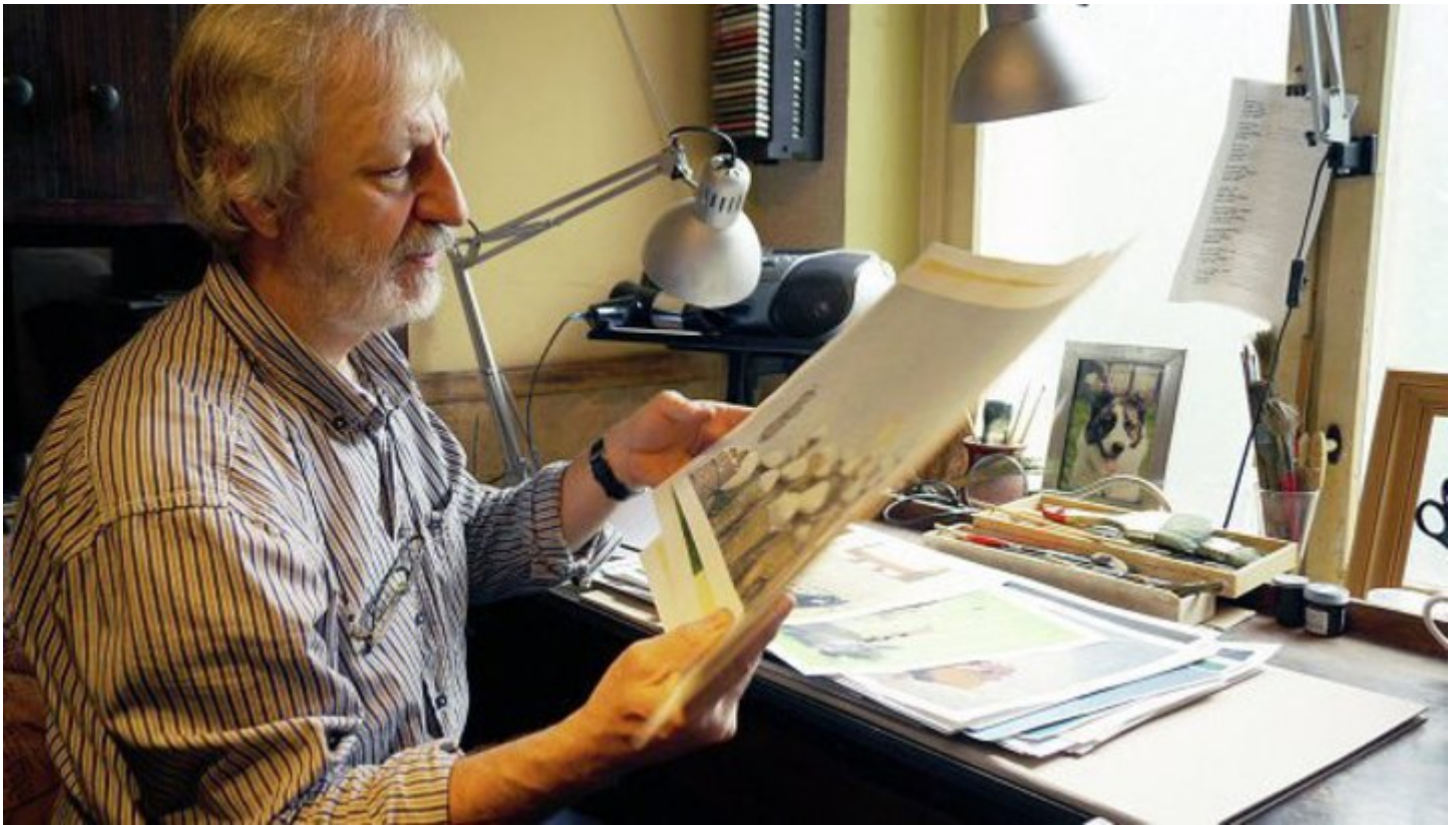
Рис. 11 Процесс создания иллюстраций

Каждого автора, особенно начинающего, интересует какие этапы проходит рукопись в книжном издательстве, прежде чем стать настоящей книгой. Когда знаешь, легче ориентироваться по времени в сроках этапов и объёме работ.