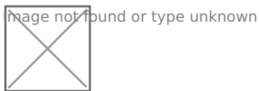
Рис.3 Внешние и внутренние элементы книги

Книга приобрела привычный нам вид ещё в I в н.э. С тех времён основные элементы книги практически не изменились. Различают внешние и внутренние элементы книги (рис.3).